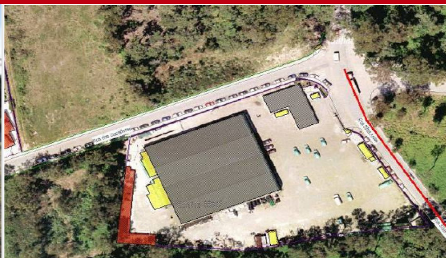
Perafita - Matosinhos