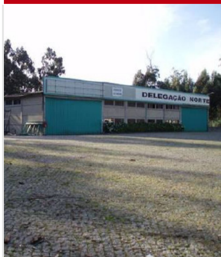
Armazém / Terreno