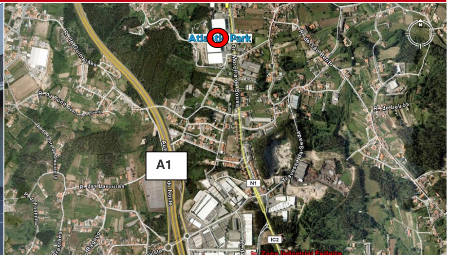
Carvalhos, VN Gaia