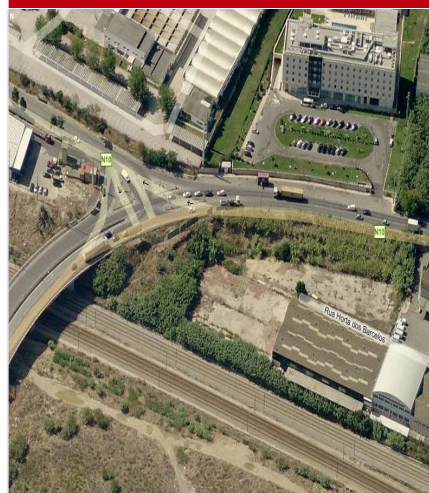
Terrenos / Armazéns