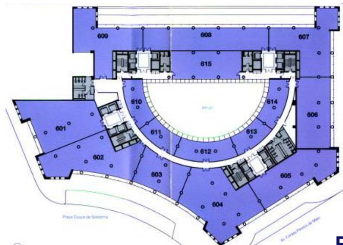
Planta do piso tipo

A todos os valores acresce IVA à taxa legal.