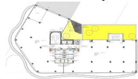
Planta do piso tipo

A todos os valores acresce IVA à taxa legal.