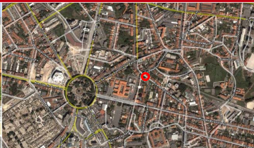
Boavista Palace Offices