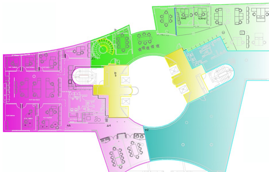
Planta do 12º piso

A todos os valores acresce IVA à taxa legal.