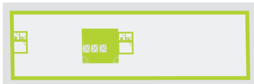
Planta do piso tipo